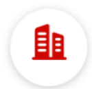
单位职工缴费信息查询